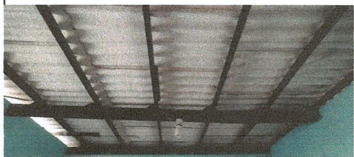
Foto 4: Sustitución de soporte de techo de madera por costaneras galvanizadas