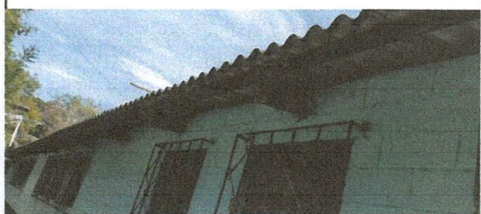
Foto 6: Sustitución de canales galvanizadas cuadrados para bajada de agua

Observación: Si es necesario se pueden agregar hojas adicionales y se contabilizan como hojas.