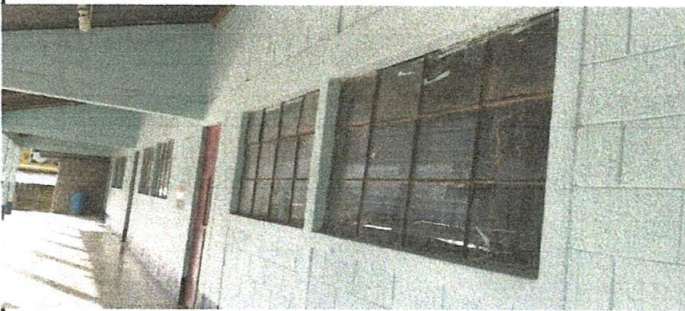
Foto 5: Sustitución de balcones a ventanas de 2 mts de largo por 1 mts de alto