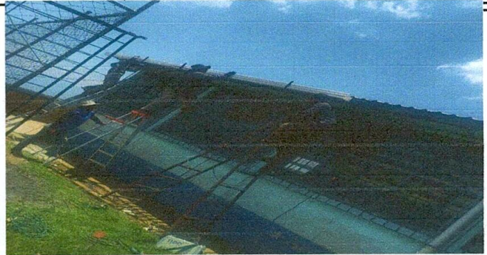
Foto 2: trabajadores contratados cambiando canal de metal por PVC