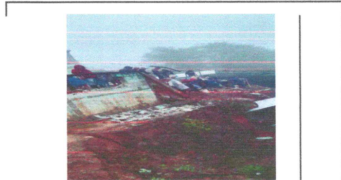
Foto 2: así quedó el muro de contención cuando se desplomó el 15 de junio 2024