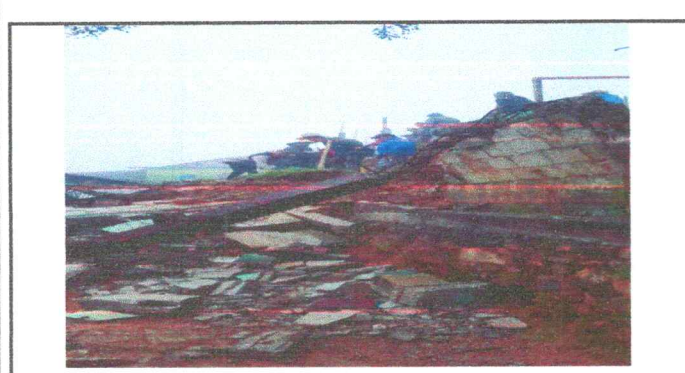
Foto 1: así quedó el muro de contención y perimetral cuando cayó el 15 de junio de 2024