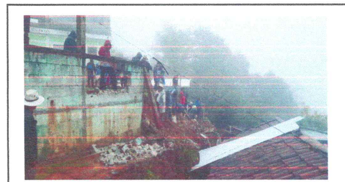
FOTO 4: otro panorama del muro de contención cuando los comunitarios colaboraron en limpiarlo el 15 de junio de 2024