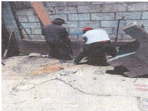
Foto 3: Quintando parales para colocar costanera de metal en el área de los baños