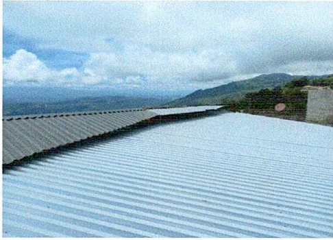
Foto1: finalizacion del techo cocina