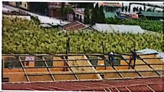
Foto 1: Sustitución de lamina, por lamina troquetada aluzinc calibre 28