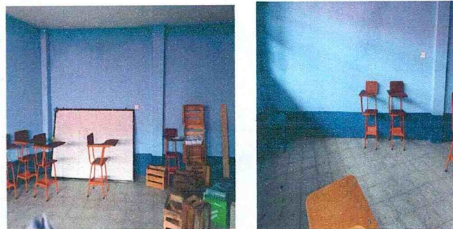
Reparación de repello en paredes de aulas