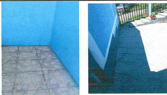
Sustitución de canal PVC