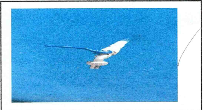
Reparación de drenaje (sustitución de llave de chorro)