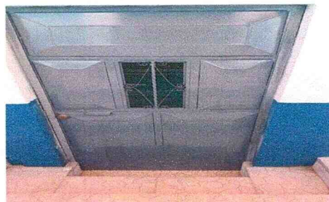
Reparación de puertas de metal (pintura y cambio de chapa)