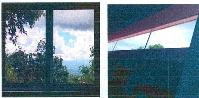
Sustitución de estructura de metal y vidrio en ventanas