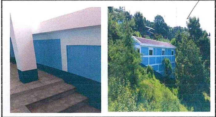
Pintura en muros interiores y exteriores