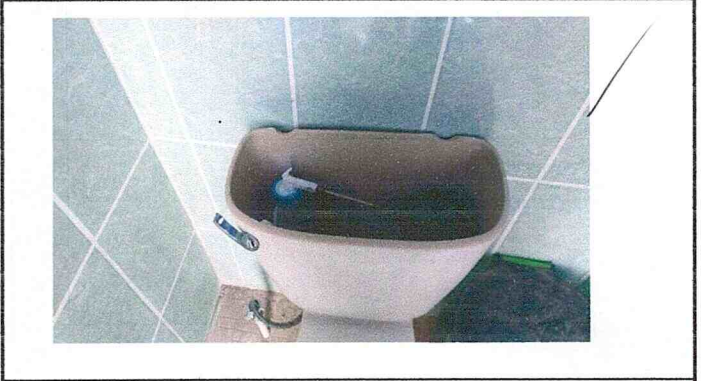
Mantenimiento en servicios sanitarios y accesorios