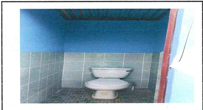
Reparación y mantenimiento de azulejo (servicio sanitario)