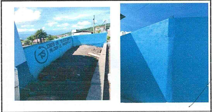
Reparación de muro de contención (ampliación)

Observación: Si es necesario se pueden agregar hojas adicionales y actualizar el número de hojas.