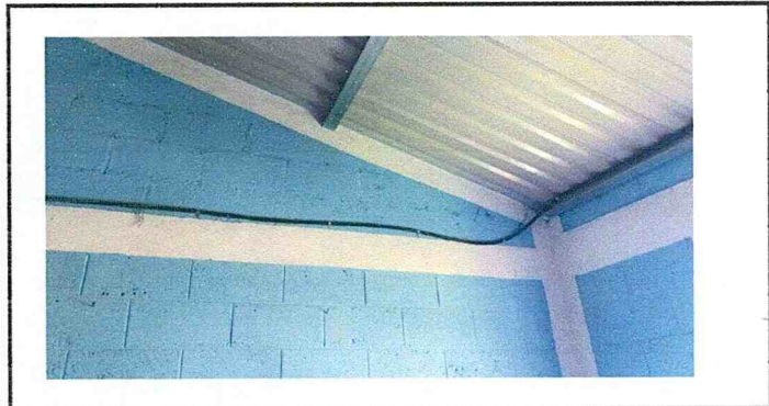
Reparación del sistema eléctrico