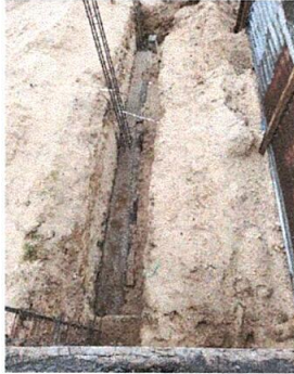
Foto1: SUSTITUCIÓN DE MURO PERIMETRAL