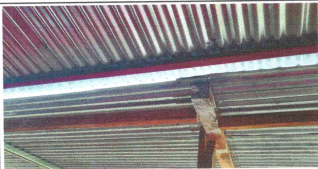
Foto 5: Sustitución de soporte o pescante de metal para canal y canales de bajadas de agua pluvial