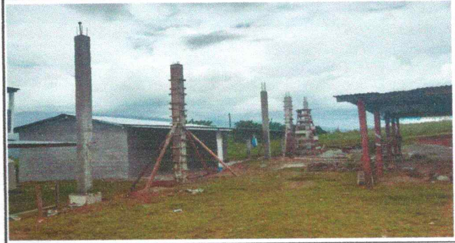
Foto 2: Sustitución de estructura de soporte de madera por metal, comprometiéndose los padres de familia a colocar columnas de concreto