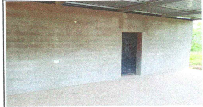
Foto 4: Sustitución de piso de torta de concreto a cemento líquido en corredor de dirección