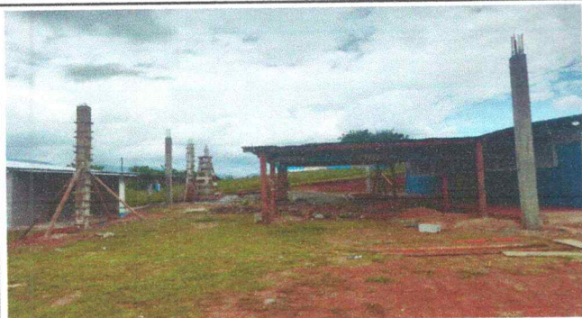
Foto 1: Sustitución de lámina en el patio, por lámina troquelada aluzink calibre 26, comprometiéndose los padres de familia a colocar columnas de concreto