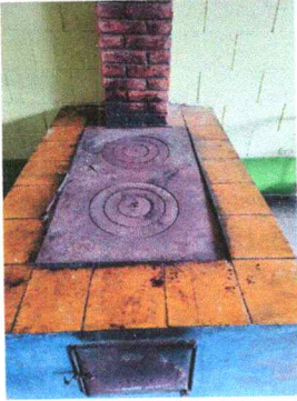
Foto1: Sustitución de azulejo en estufa rural