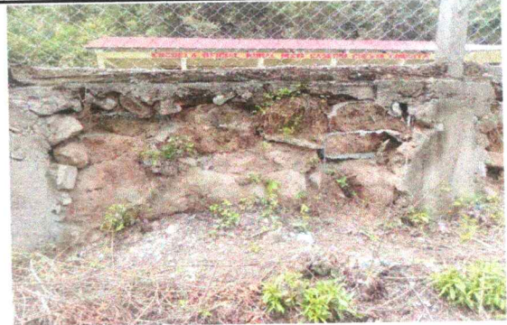
Foto 4: Reparación de Muro perimetral de block con tubo hg y malla galvanizada, soleras intermedias y columnas