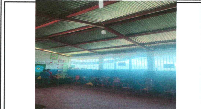
Foto13: 17.5 Sustitución de plafoneras