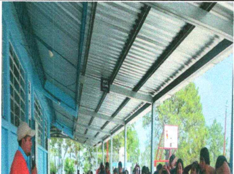
Foto19: 14.5 sustitucion de plafonera