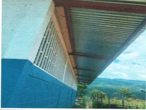
Foto7: 9.2 Mejoramiento de paredes de aula