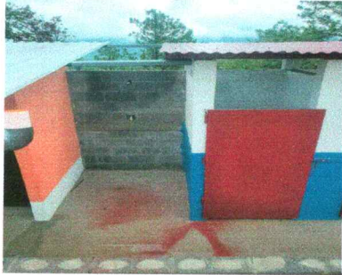
Foto1: 1.1 sustitución de lámina por lámina troqueada aluzinc calibre 26