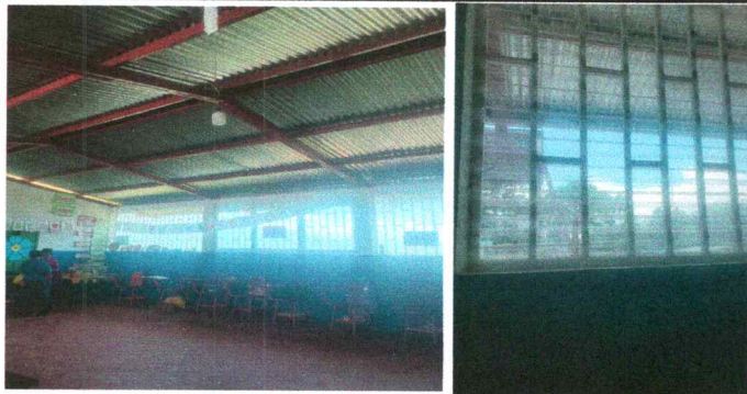
Foto 3: 5.8 Sustitución de estructura de ventana + vidrio para ventana