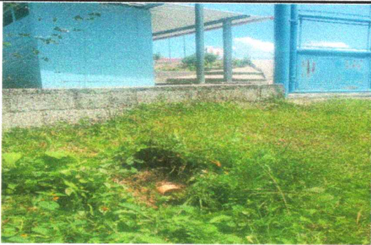
Foto 9: 14.4 Sustitución de tubería PVC línea principal aguas pluviales