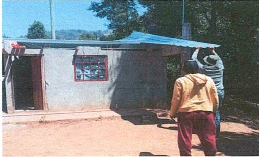
Foto1: Sustitucion de lamina