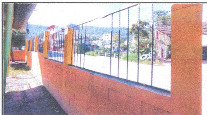
Foto 4: Muro perimetral en malas condiciones, genera peligro para los niños.