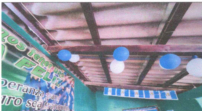
Foto 3: Estructura de madera en malas condiciones, por dentro se encuentra con polilla.