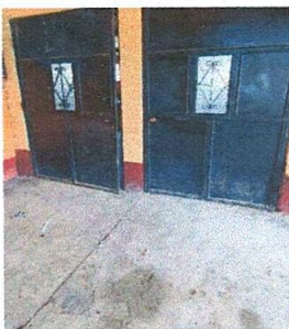
Foto No 05 Sustrucion de puertas