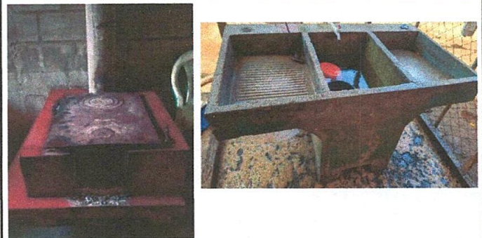
Foto No 04: sustutucion de plancha artesanal y pilas de cemento de dos lavaderos