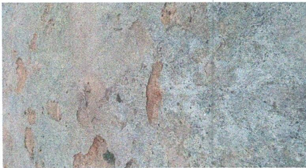
Foto No 03. Sustrucion de piso de torta de concreto