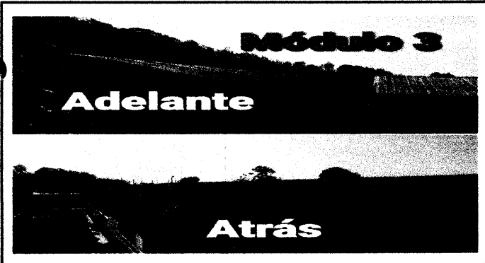
FOTO 3 SUSTITUCIÓN MÓDULO 3