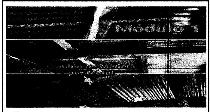
FOTO 4 SUSTITUCIÓN SOPORTE ESTRUCTURA MADERA POR METAL