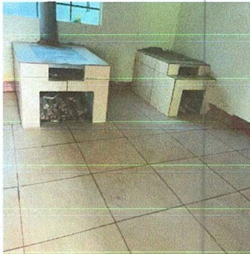
Foto No. 5: Sustitución de estufa rural, incluye chimenea y plancha de metal.