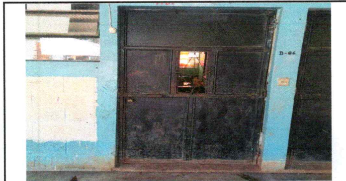
Foto 5: Cambio de puertas de 7 aulas mismas que se encuentran en pesimas condiciones las cuales ya no ofrecen seguridad al inmovillario que posee el Centro Educativo.