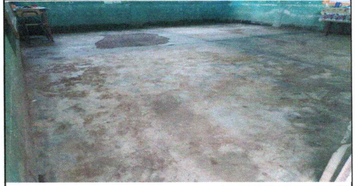
Foto 2: Aula No. 02. la segunda aula se encuentra en las mismas condiciones con un piso deteriorado.