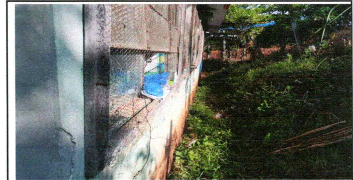
Foto 6: El Centro Educativa cuenta con dos edificios, la pintura se encuentra desgastada la cual no le otorga una vista agradable a nuestro espacio educativo.

Observación: Si es necesario se pueden agregar hojas adicionales y actualizar el número de hojas.