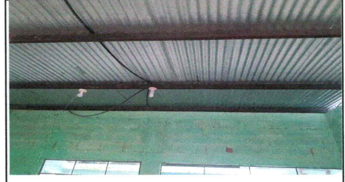
Foto 4: Cambio de costaneras de dos aulas con las siguientes medidas 11 Mts de ancho y 13 Mts de largo en su totalidad.