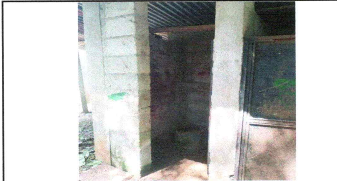
Foto 3: El piso de los sanitarios activos se encuentran en un estado pesimo mismos que no ofrecen un ambiente higienico para nuestros niños.