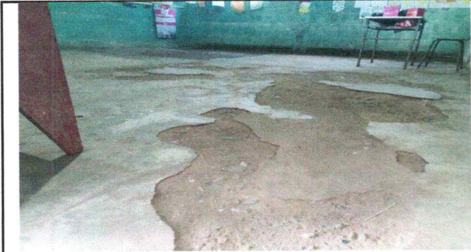
Foto 1: Aula No. 01. El piso de las aula estan deterioradas en su total, no es un espacio abto para los estudiantes.