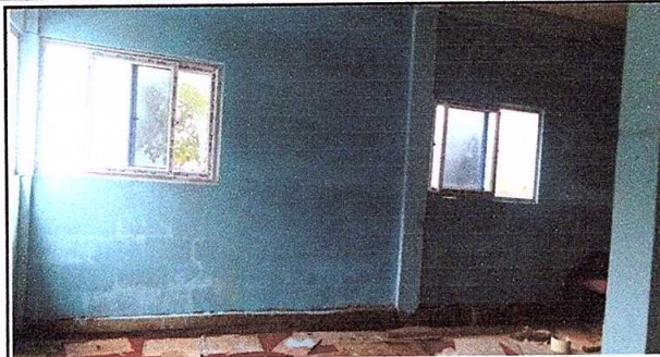
Foto 1: cocina a medio construir pendiente, pared, piso puertas y ventanas