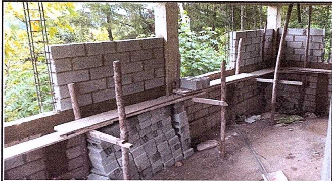
Foto 1: cocina a medio construir pendiente, pared, piso puertas y ventanas