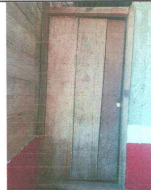
Foto 4: Sustrucción de puerta de madera por metal de 2.10mtrs de alto y 1.10 de ancho