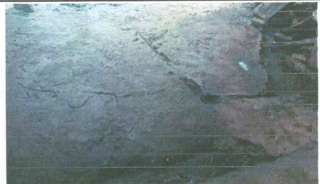
Foto10: Reparación de plancha de concreto de patio