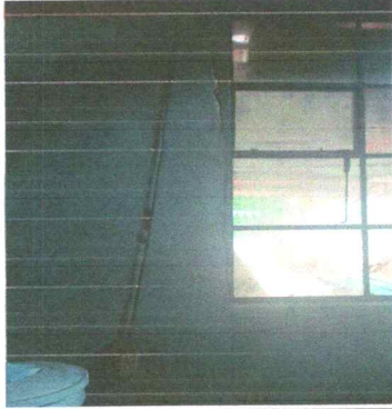
Foto7: Sustitución del ducto eléctrico y sus accesorios