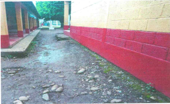
Foto9: Reparación de cuneta de concreto