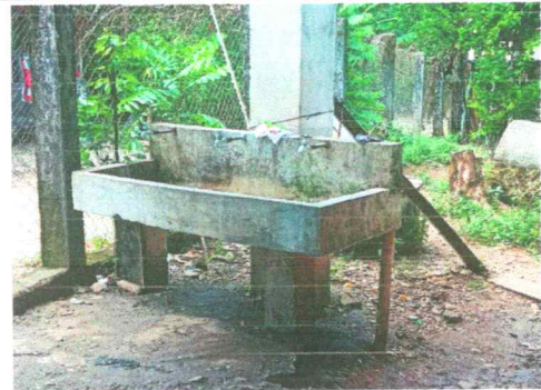
Foto12: Sustitución de lavamanos

Observación: Si es necesario se pueden agregar hojas adicionales y actualizar el número de hojas.