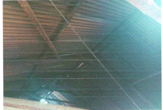
Foto8: Sustitución de soporte de madera por metal.