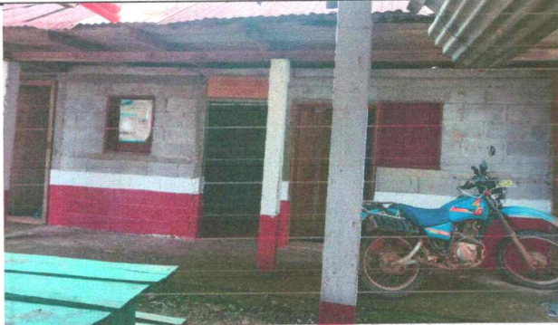
Foto11: Pintura en muros exteriores e interiores