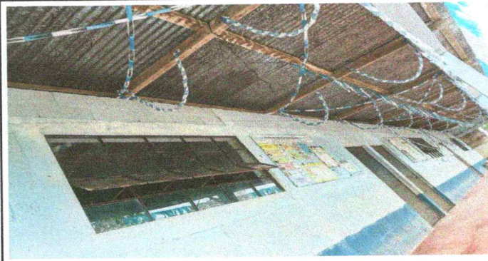
Foto 2: Sustitución de estructura de soporte de madera, por metal.