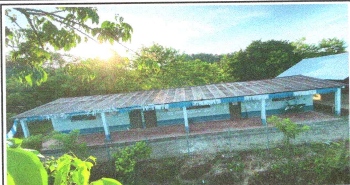
Foto 1: Sustitución de láminas, por lámina troquelada calibre 26.