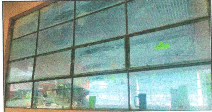
Foto 4: Sustitución de estructura de metal de ventanas de 2 metros de largo x 1,75 de ancho