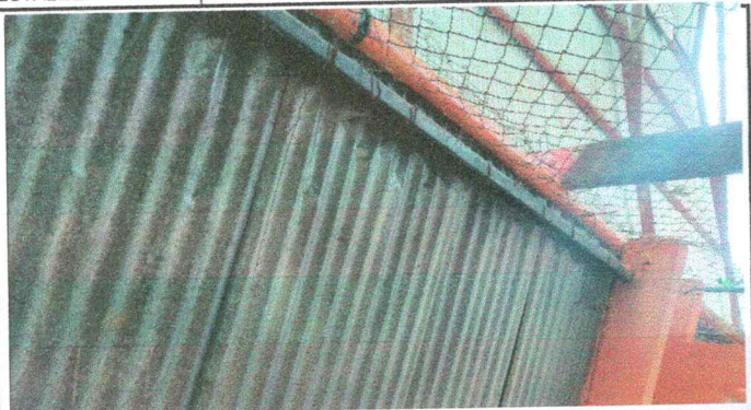
Foto1: sustitución de lámina en malas condiciones