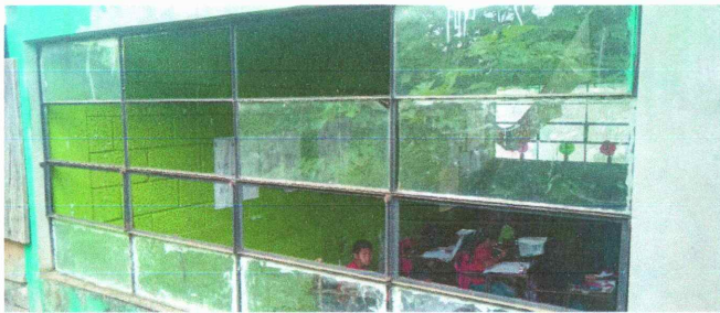
Foto 5: Sustitución de ventanas de metal más vidrio de 1.25 x 2.76 Mts.