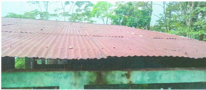
Foto 1: Sustitución de láminas, por lámina troquelada aluzinc calibre 26