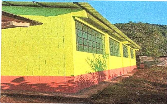
Foto No. 5 Pintura de pared.