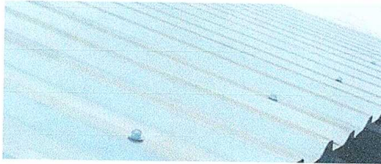
Foto No. 3 Sustitución de elementos de fijación.