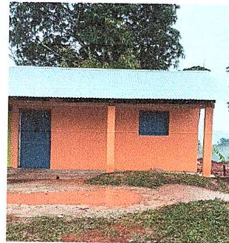
Foto No. 6 Reparación de cocina.

Observación: Si es necesario se pueden agregar hojas adicionales y actualizar el número de hojas.