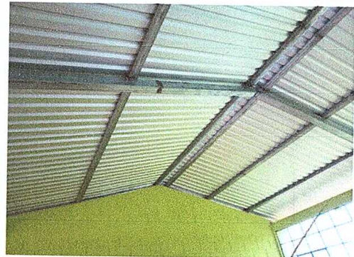
Foto No. 4 Sustitución de estructura de madera por metal.