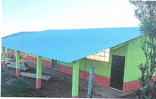
Foto No. 1 Sustitución de techo.