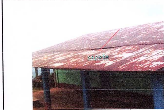
Foto No. 2 sustitución de capotes