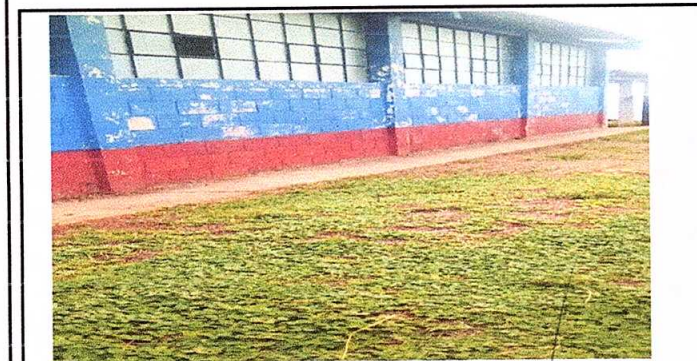
Foto No. 5 pintura de pared