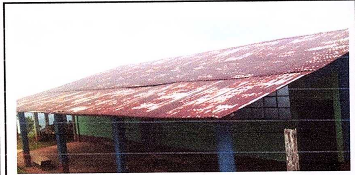
Foto No. 1 sustitución de techo