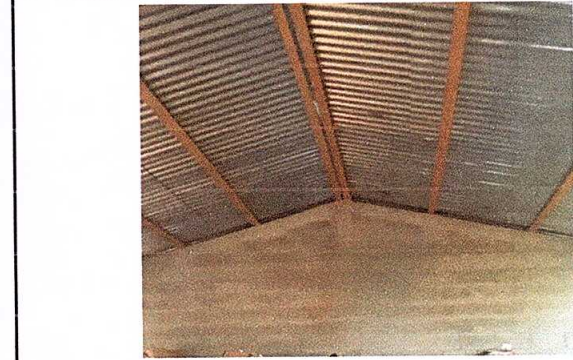
Foto No. 4 sustitución de estructura de madera por metal