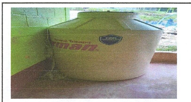
Foto 6: Sustitución de deposito de agua por otro de 1,100 litros.

Observación: Si es necesario se pueden agregar hojas adicionales y actualizar el número de hojas.