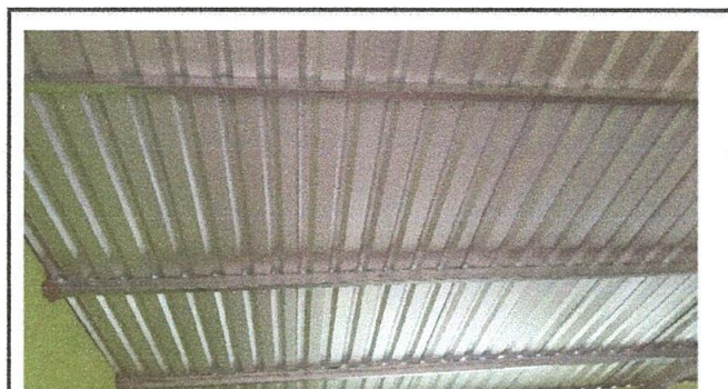
Foto 4: Sustitucion de láminas troqueladas, por malas condiciones.