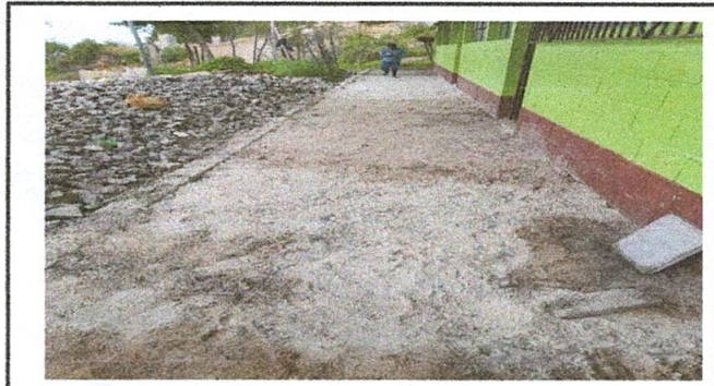
Foto1: Corredor de la escuela