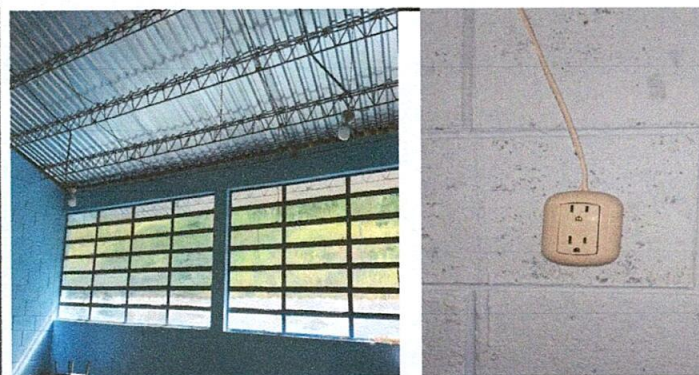
Foto 5: Reparación de lámparas, sustitución de tomacorrientes dobles y reparación de cableado eléctrico