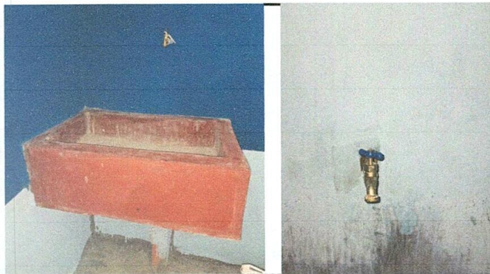
Foto 4: Sustitución de tubería PVC línea principal aguas negras y sustitución de llave de chorro