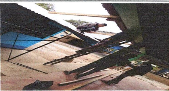
Foto 5. Están colocando las primeras reglas que van a sostener las láminas troqueladas.