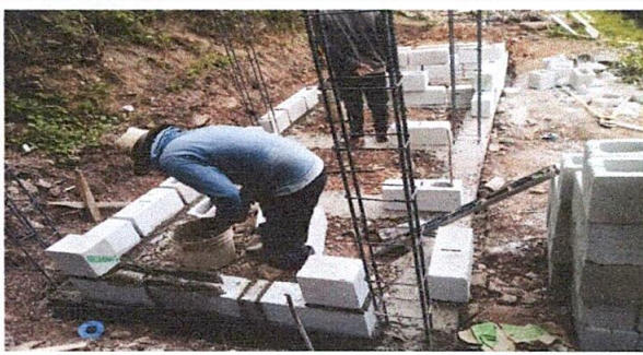
Foto 3. Se está empezando a establecer el cimiento de cada uno de los servicios sanitarios.