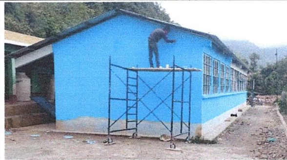
Foto 2. Se está pintando de manera general la parte externa del centro educativo.