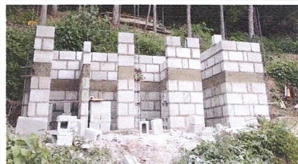
Foto 4. Los servicios sanitarios están a la mitad, ya sólo falta la terraza para terminar la base.