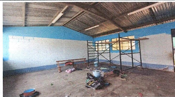
Foto 1. Se está pintando la parte interna de cada una de las aulas del centro educativo.