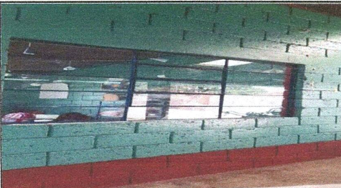
foto 3. Ventanas instaladas