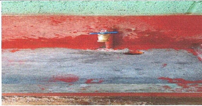
foto 9. Chorro instalado