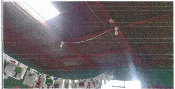
foto 10. Focos led instalados

Observación: Si es necesario se pueden agregar hojas adicionales y actualizar el número de hojas.