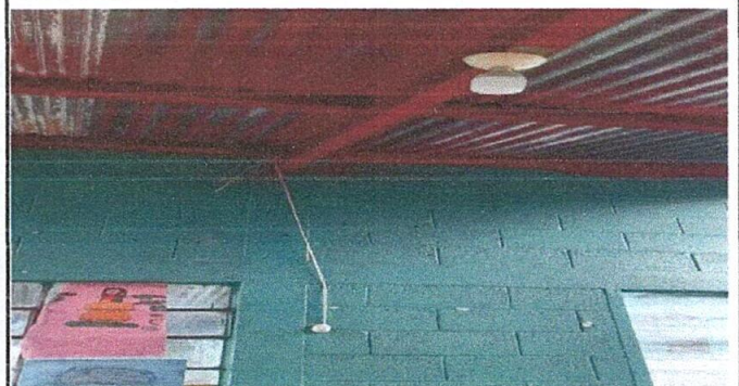
foto 8. Interruptor simple instalado