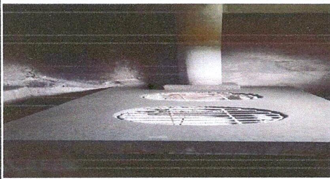
foto 1. Estufa terminada