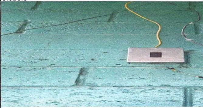
foto 7. Flipon instalado