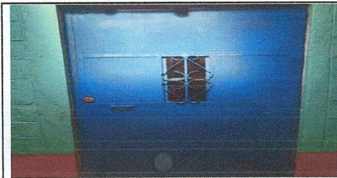
foto 5. Puerta instalada