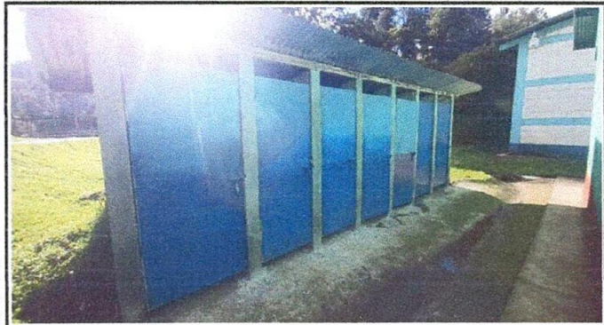
foto 4. Puertas instaladas en los servicios sanitarios