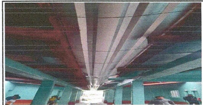
foto 6. Canales instalados