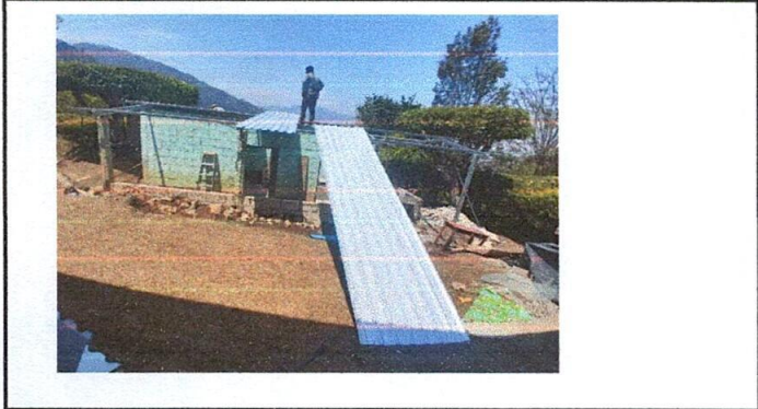
Foto1: Sustitución de lámina