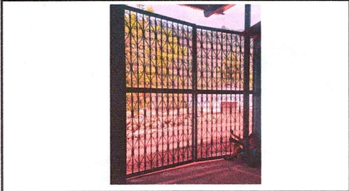
Foto 2 MANTENIMIENTO A PORTÓN