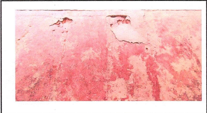
Foto 1 REPARACIÓN DE PISO DE TORTA DE CONCRETO