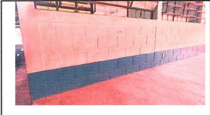
Foto 4 PINTURA EN MUROS EXTERIORES E INTERIORES