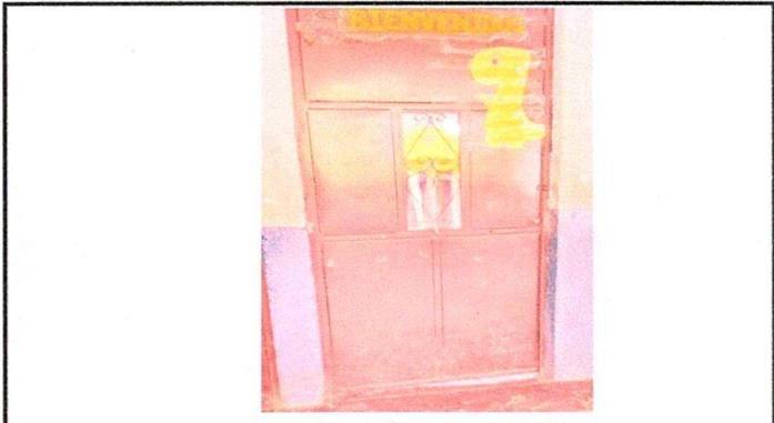
Foto 3 MANTENIMIENTO A ESTRUCTURA DE PUERTAS