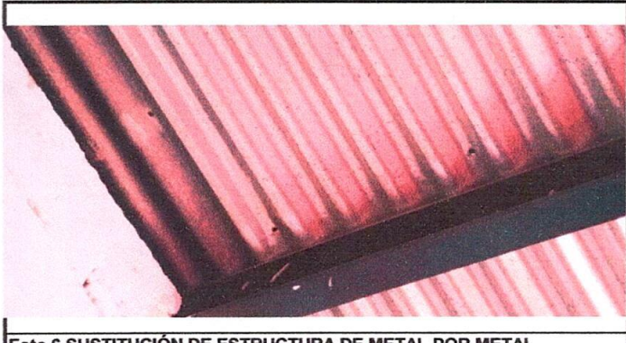
Foto 6 SUSTITUCIÓN DE ESTRUCTURA DE METAL POR METAL

Observación: Si es necesario se pueden agregar hojas adicionales y actualizar el número de hojas.