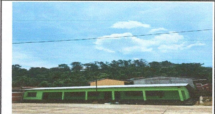
Foto 2: Sustitución de lámina, por lámina troquelada aluzin calibre 26