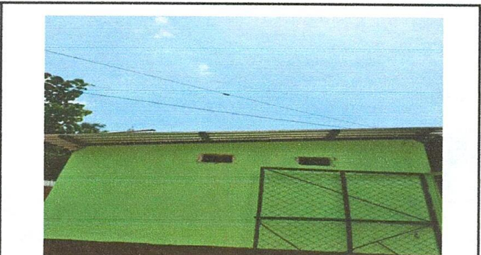
Foto 4: Sustitución de estructura de soporte de madera, por metal 4x4