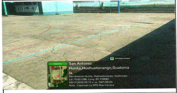
Foto7: Reparación de piso de torta de concreto