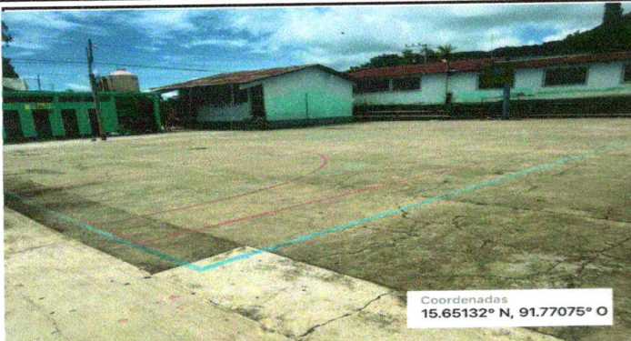
Foto1: Reparación de piso de torta de concreto