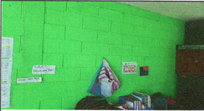
Foto13: PINTAR PARED INTERIOR