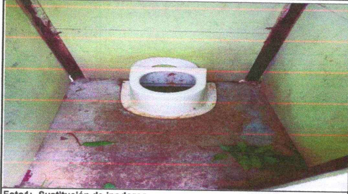
Foto1: Sustitución de inodoros