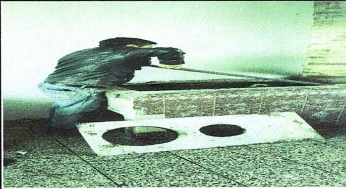
Foto1: Sustitución de plancha de metal.