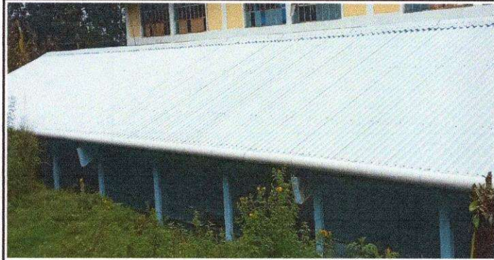
Foto1: Sustitución de lamina