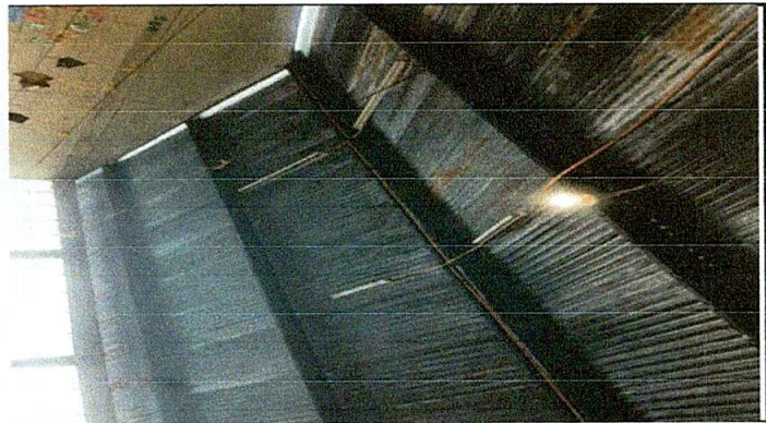
Foco 4: Sustitucion de foco por foco