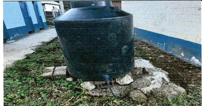
Foco 6: Sustitucion de rotoplas por rotoplas

Observación: Si es necesario se pueden agregar hojas adicionales y actualizar el número de hojas.