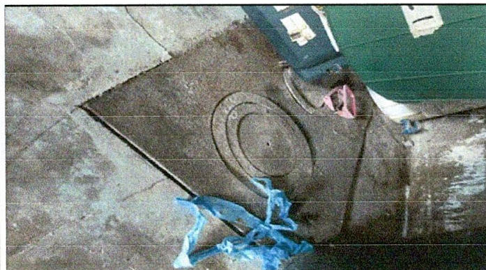
Foco 3: Sustitución de plancha por plancha