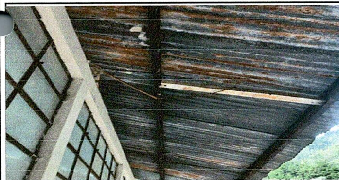
Foco 5: Sustitución de cable solido