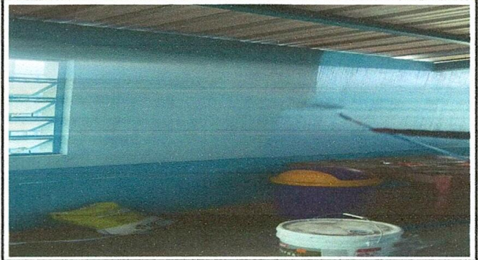
Foto. 2 Pintada de muros interiores