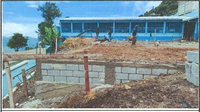
Foto 4. Trabajos realizados en sustitucion de muros