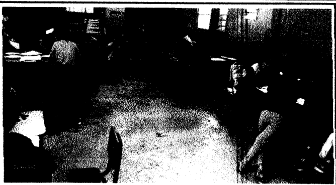
Foto 2: Piso de torta de cemento a desnivel que provoca que el agua de lluvia ingrese a las aulas