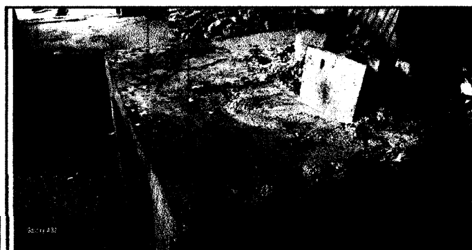
Foto 5: Mesa de concreto de la cocina en desuso por el mal estado en que está.