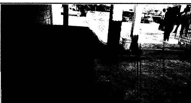
Foto 6: Pila de dos lavaderos en desuso por falta de tubos de aguas negras

Observación: Si es necesario se pueden agregar hojas adicionales y actualizar el número de hojas.