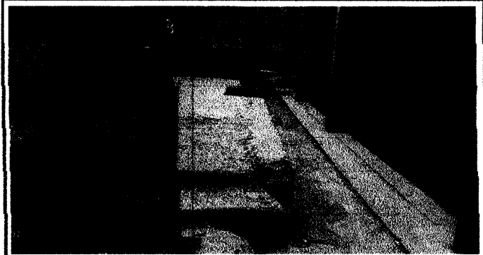
Foto 3: Banqueta en mal estado que evita la accesibilidad a la escuela