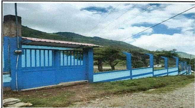
Foto: Portón finalizado