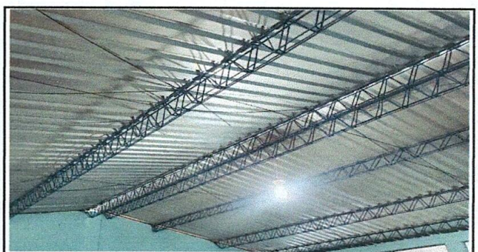
Foto: Mantenimiento de soporte de estructura de metal finalizada.

Observación: Si es necesario se pueden agregar hojas adicionales y actualizar el número de hojas.