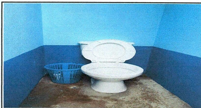
Foto: Servicio sanitario finalizado.