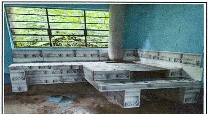
Foto: Estufa rural finalizada.