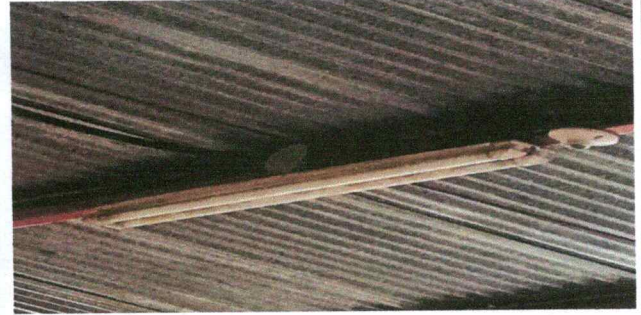
Foto 2. Los focos que ya no sirven