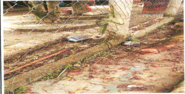
Foto 6. Malla en mal estado

Observación: Si es necesario se pueden agregar hojas adicionales y actualizar las hojas.