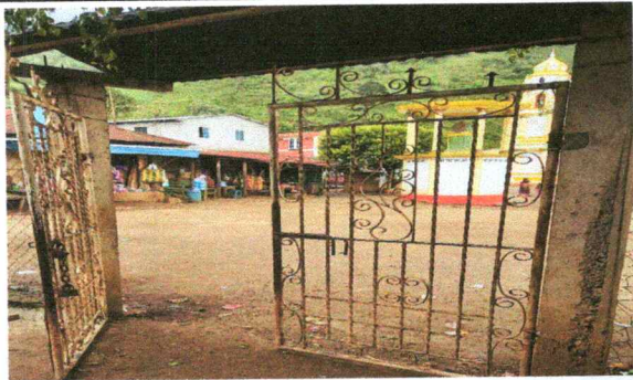
Foto 3. El portón que se encuentra en mal estado provocando inseguridad