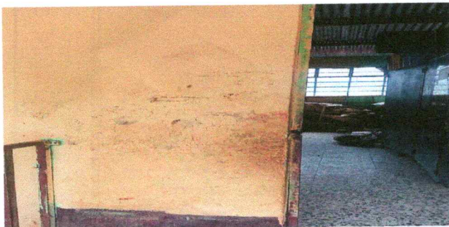
Foto 5. Paredes sucias