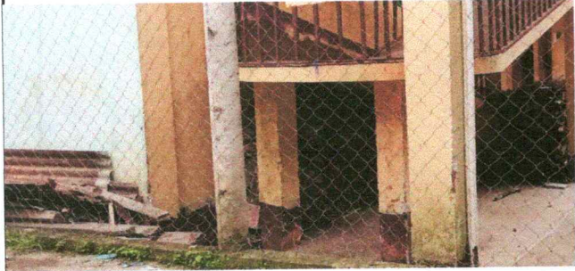
Foto 1. malla en mal estado que provoca inseguridad en el centro educativo