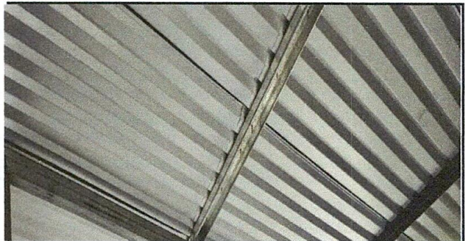
foto2 cambio de soporte de techo