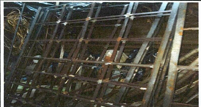
foto 4 ventanas en proceso de arreglar