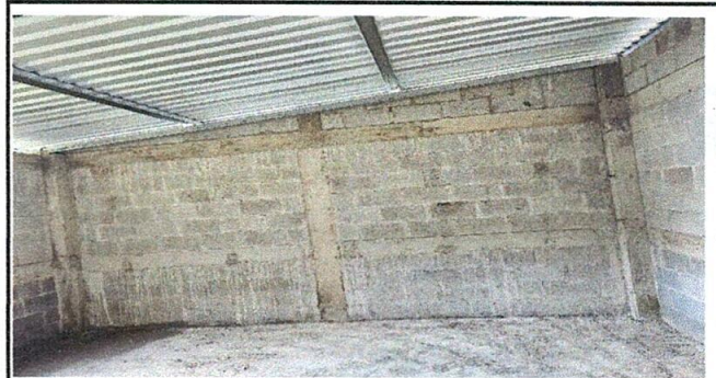
foto 6 aulas con paredes completas

Observación: Si es necesario se pueden agregar hojas adicionales y actualizar el número de hojas.