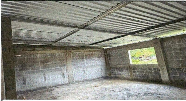
foto 1 cambio de laminas en deterio