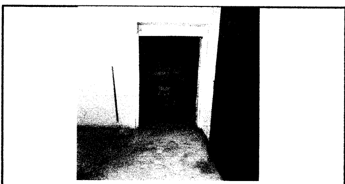
Piso 6: sustitución de puertas

Observación: Si es necesario se pueden agregar hojas adicionales y actualizar el número de hojas.