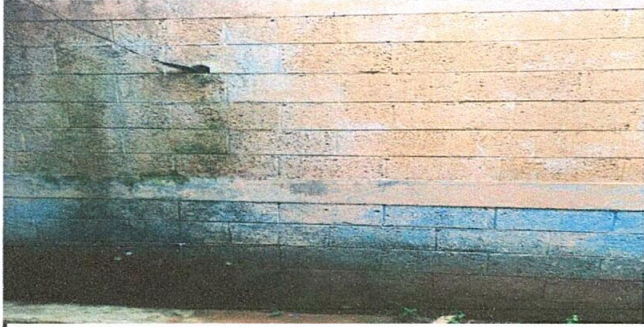
Foto 1: Sustitución de pinturas exteriores e inferiores en el centro Educativo