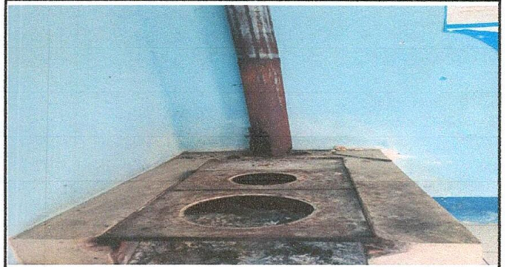
Foto 4: Sustitución de plancha de metal y chimenea de metal por tuvo de concreto