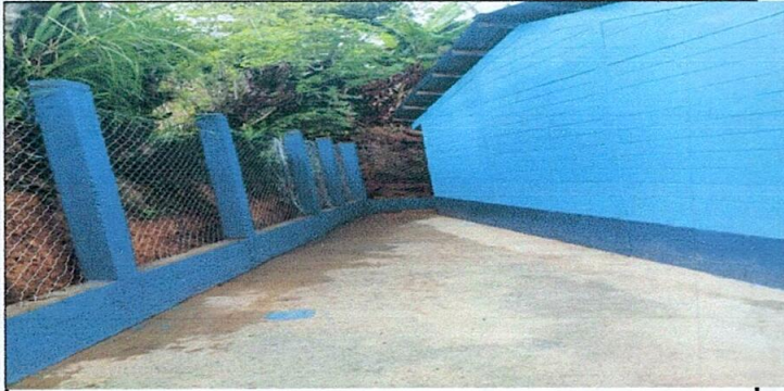
Foto1: Sustitucion de piso de cemento liquido