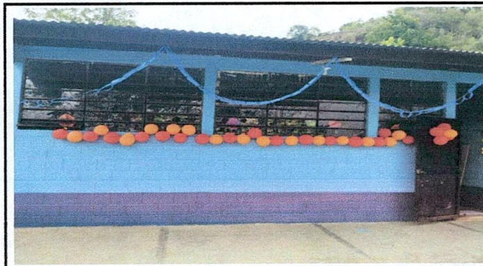
Foto 3: Sustitucion de lamina, por lamina troquelada aluzinc calibre 26