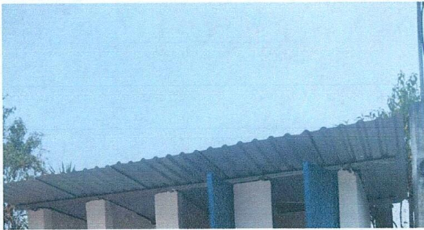
Foto 3: Sustitucion de lamina, por lamina troquelada aluzinc calibre 26.