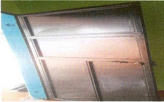
Foto1: puerta nueva