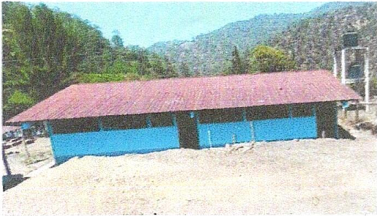
Foto: 1 Teja en mal estado