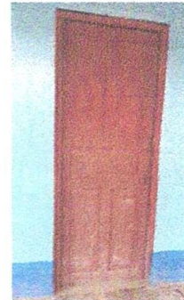
Foto: 2 Puerta en mal estado