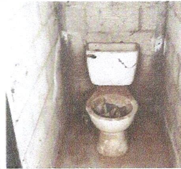
Foto: 4 inodoro inservible