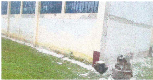
Foto 3: El repello de las paredes se cayó en su totalidad y es necesaria la remodelación en estos espacios. Para evitar la filtración de humedad.