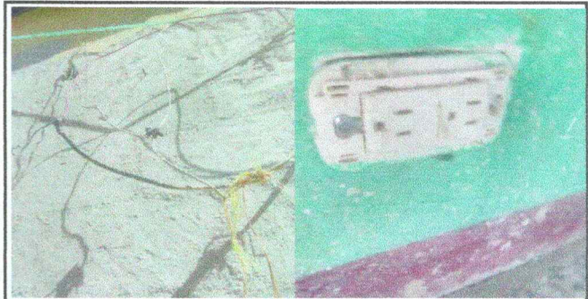
Foto 6: El establecimiento carece de sistema eficiente de energía eléctrica por deficiencias en la instalación y cortos circuitos.

Observación: Si es necesario se pueden agregar hojas adicionales y registrar el número de hojas.