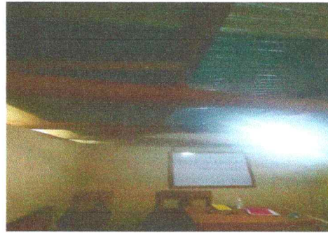
Foto 2: Las costaneras tienen muchos años de uso y a causa de los sismos se deterioraron mucho más.