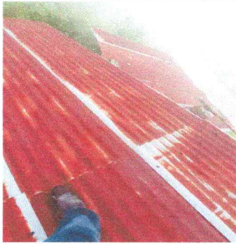
Foto 1: El techado presenta agujeros y láminas desgastadas. Es evidente el mal estado de la cubierta del establecimiento.