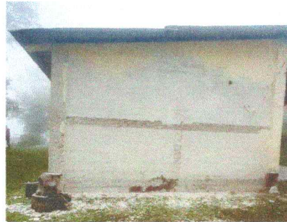
Foto 4: Hace años se construyó el centro educativo y no a tenido mantenimiento en sus paredes interiores y exteriores.