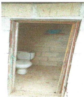
Foto 5: Los baños tienen un techo provisional de madera, los inodoros están fuera de servicio y el piso rustico se deterioró con el tiempo.